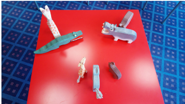
Holztiere helfen, das Erlebte darzustellen

Die Eltern zeigten sich berührt und erkannten, dass es wichtig ist, den Kindern zu vermitteln, dass die Trennung auf unterschiedlichen Bedürfnissen basiert, nicht auf Schuld. Dadurch können die Kinder besser akzeptieren, dass sie bei beiden Elternteilen willkommen sind, trotz der Trennung.