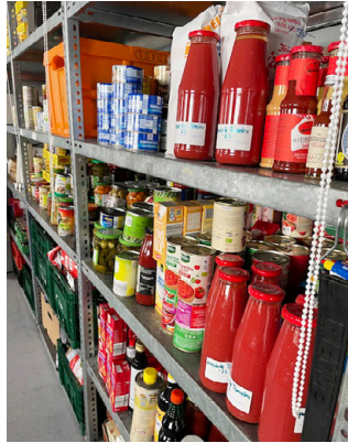
links: Bäckereien spenden Brot und Gebäck vom Vortag, Landwirtschaftliche Betriebe Eier z. B. von Junghennen; rechts: haltbare Lebensmittel