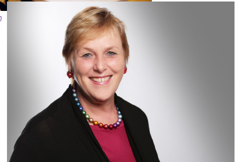
Bitte Namen durchgeben :)