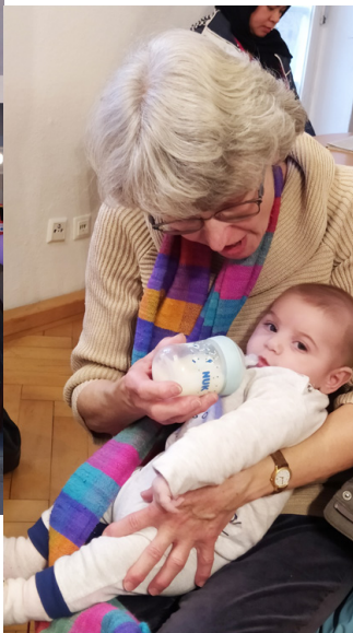
Einblicke ins Tafel-Café