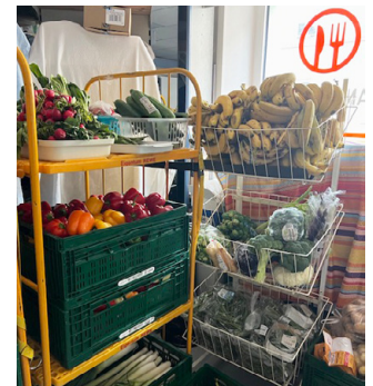
links: Milch; rechts: das gespendete Obst und Gemüse wird 2 mal wöchentlich sortiert und vorbereitet;